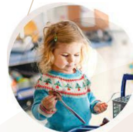
Sicher im Alltag und im Handeln