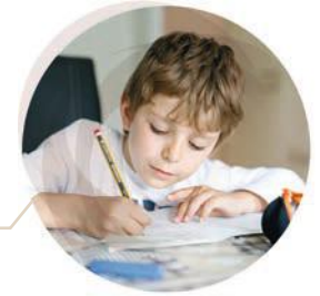
Lern- und Vorschul-Training