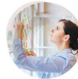
Selbstständigkeit in allen Lebenslagen